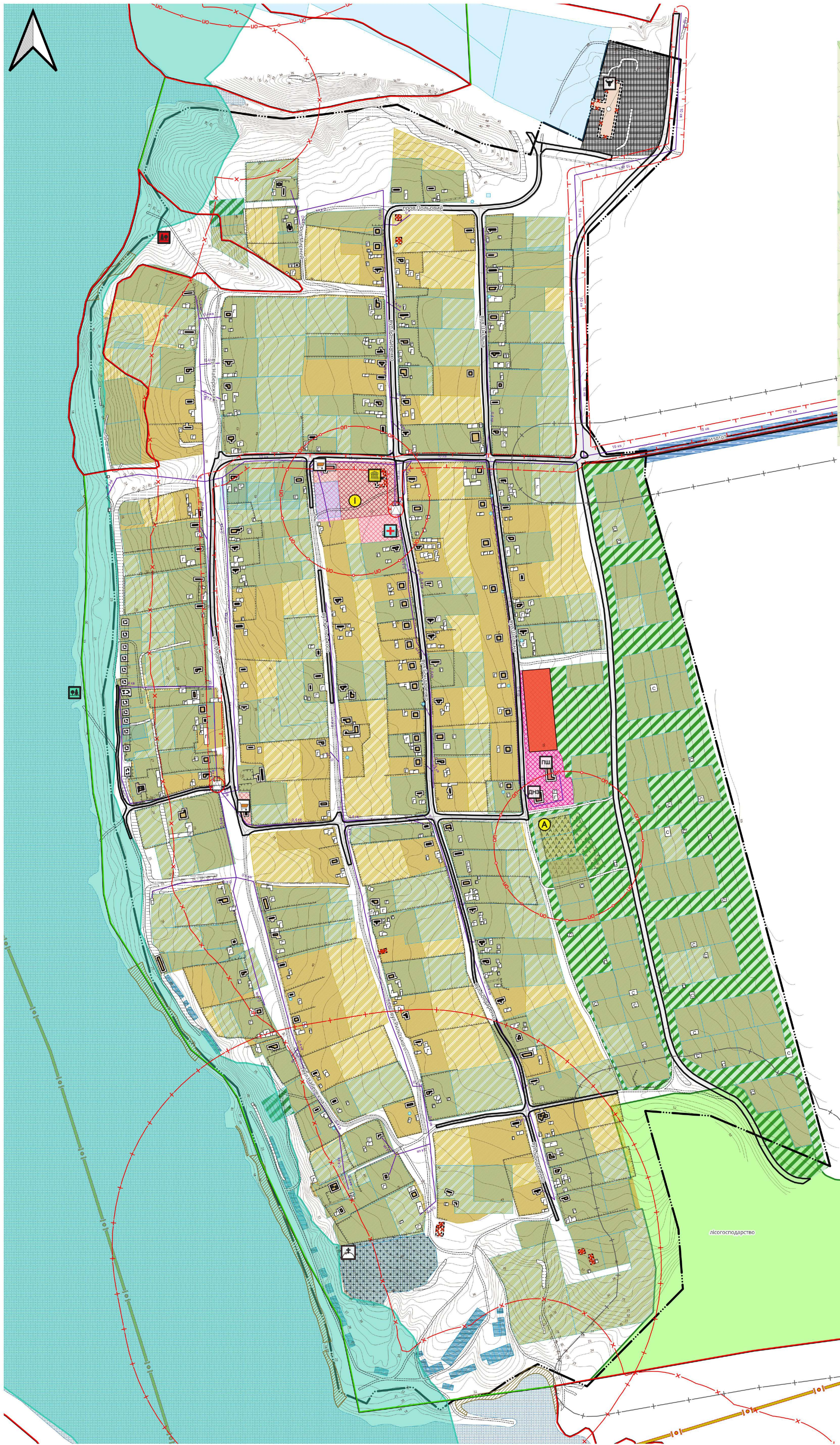
СХЕМА ЗОНИ ОБСЛУГОВУВАННЯ ПОЖЕЖНО-РЯТУВАЛЬНОГО ПІДРОЗДІЛУ