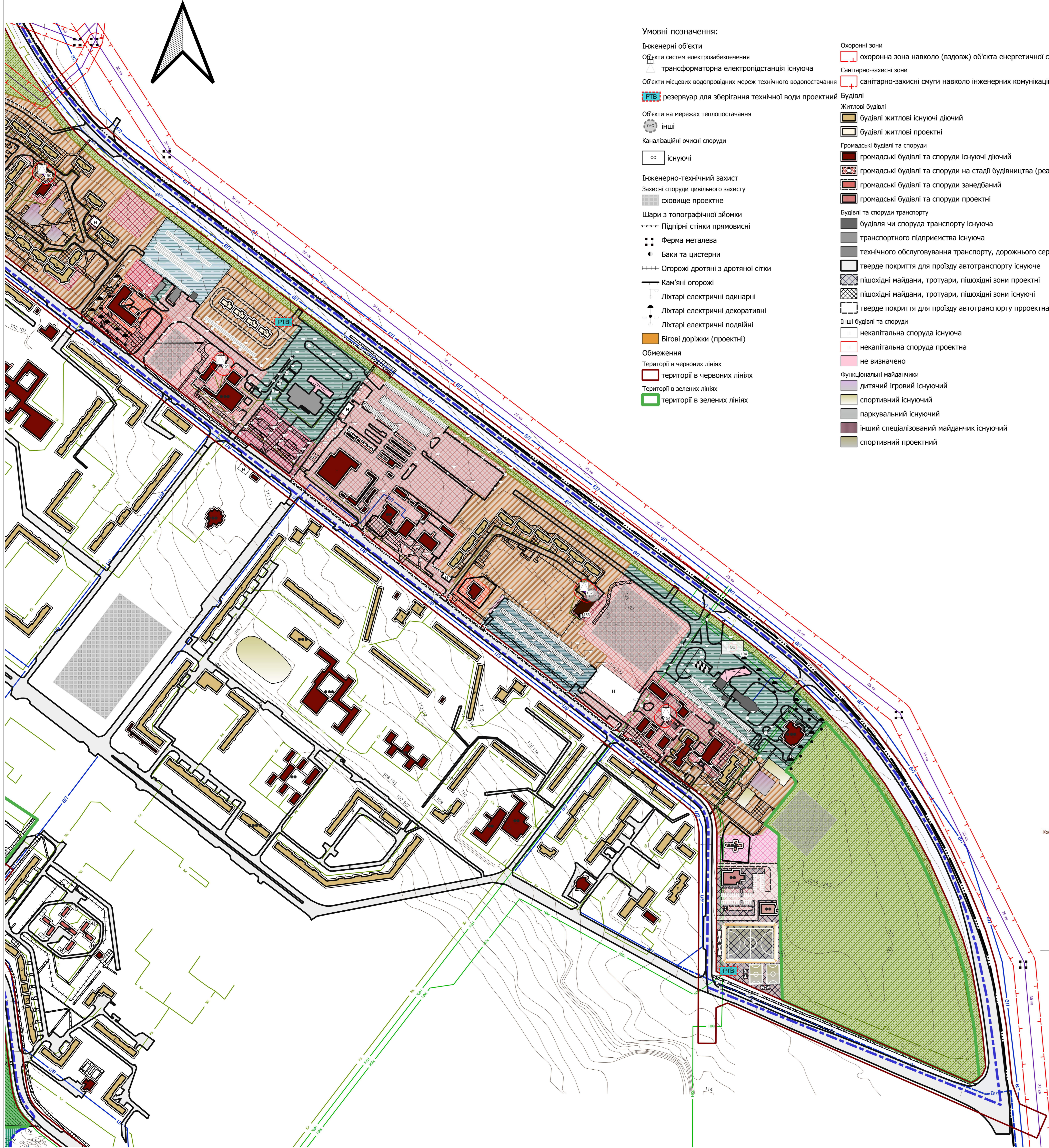
Схема інженерного забезпечення території, ділянка №3 М1:2000