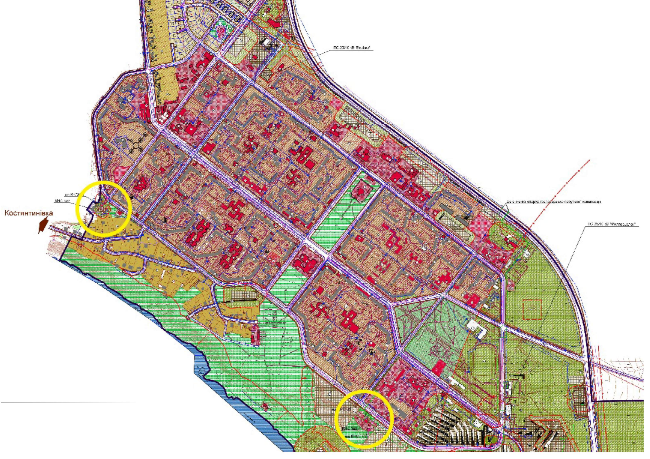
Експлікація будівлі та споруди інженерного забезпечення, ділянка №3