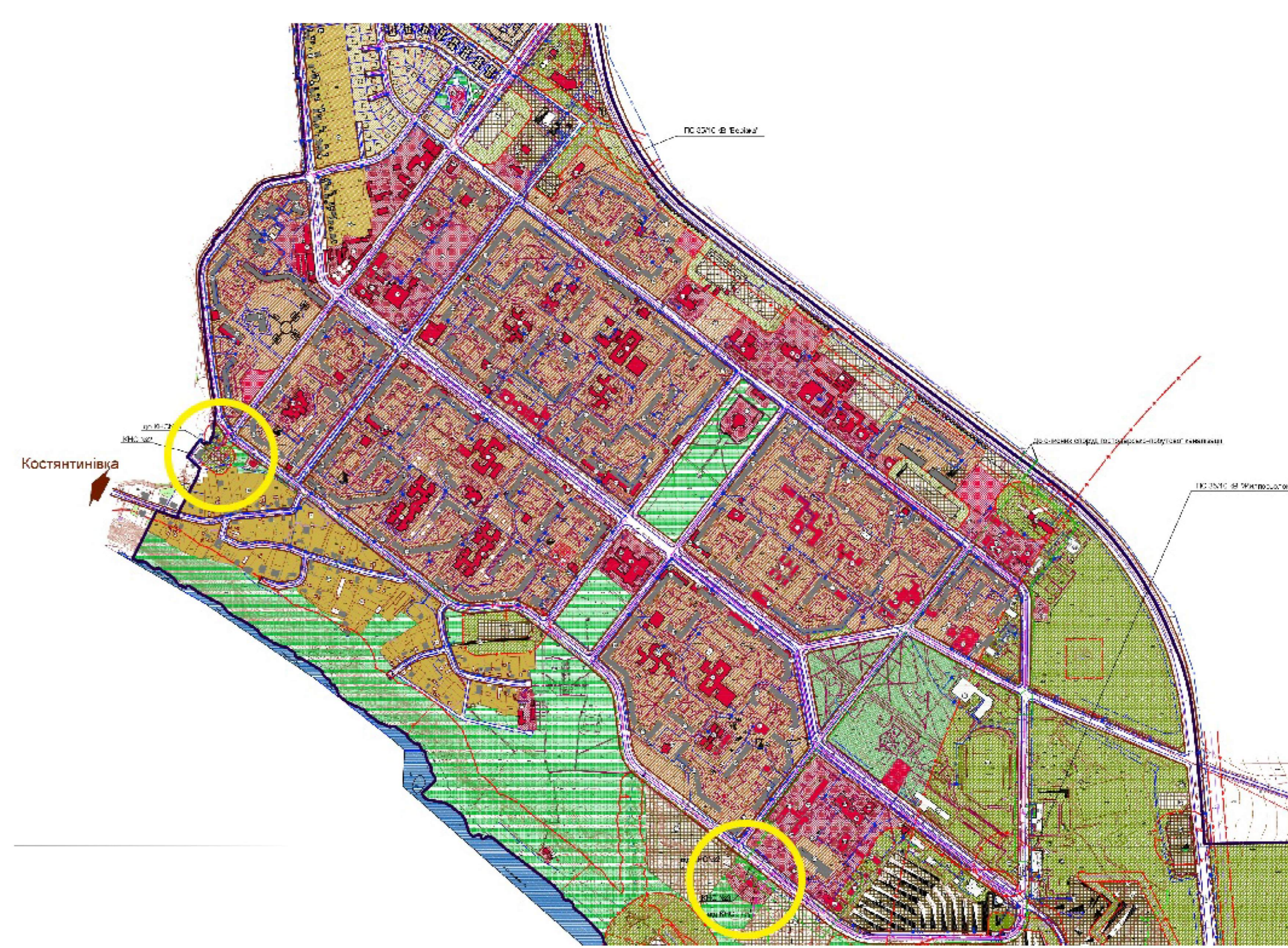
Викопіювання зі схеми інженерного обладнання території (у довільному масштабі)